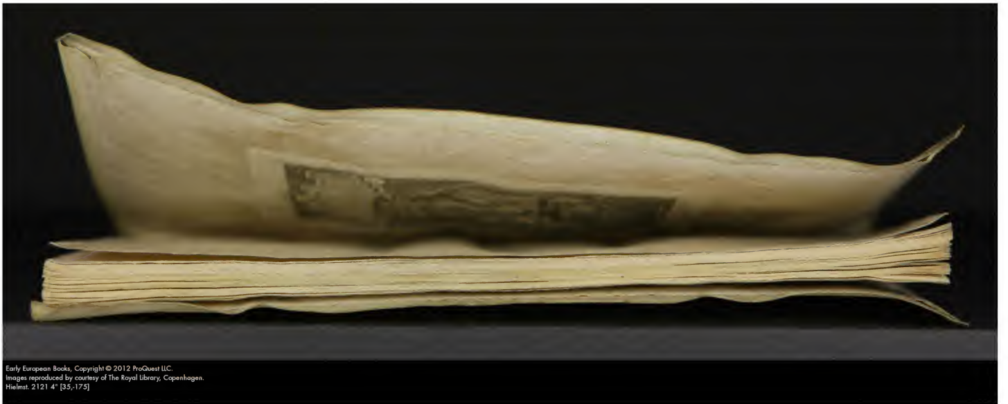
Early European Books. Hielmst. 2121 4* [35-175]